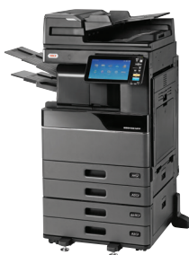
ES9466 MFP mit DSD, PPF, Schubladenmodul und integriertem Finisher vorinstalliert