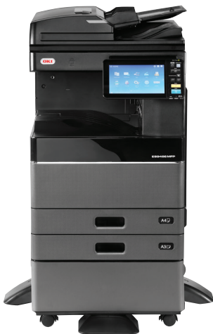
ES9466 MFP mit RADF und Schrank