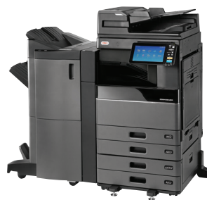
ES9466 MFP mit DSD, PPF, Schubladenmodul, Broschüren-Finisher und Lochereinheit vorinstalliert